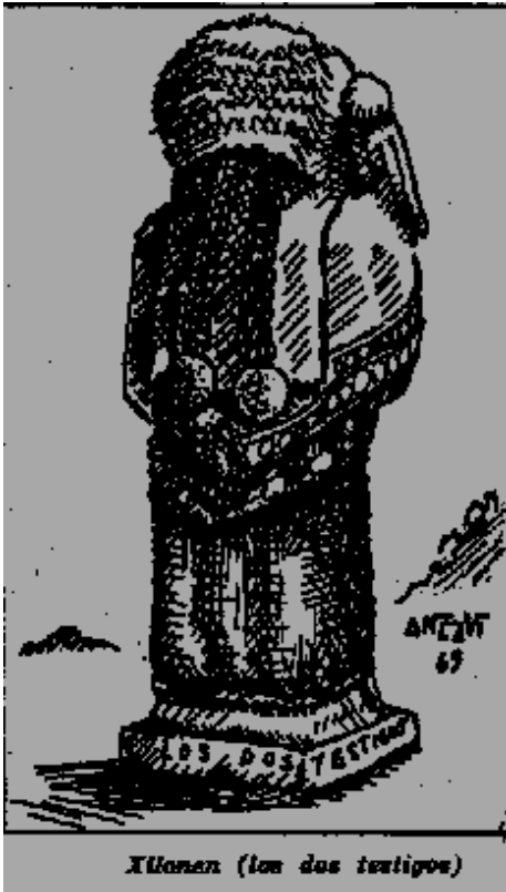
Xilonen (les deux testigos)

Ces courants solaires et lunaires montent jusqu'au cerveau. Les courants solaires sont en relation avec la fosse nasale droite et les courants lunaires avec la fosse nasale gauche. Deux cordons nerveux sympathiques partent de nos organes sexuels. Ces deux canaux s'enroulent autour de la moelle épinière et s'élèvent jusqu'au cerveau. Les courants solaires et lunaires montent à l'intérieur de ces deux conduits jusqu'au calice sacré qu'est le cerveau.