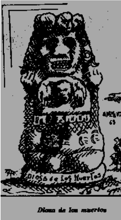
Diosa de los muertos

longue vie, il entre dans le temple de Sanat Kumara, qui lit à l'Initié toutes les conditions et exigences sacrées. Sanat Kumara est le fondateur du Collège d'Initiés de la Loge Blanche ; il vit dans une oasis du désert de Gobi, avec d'autres Initiés de la Lémurie ; tous ont conservé le même corps depuis plus de 18000000 d'années. Sanat Kumara félicite l'Initié en lui disant : « Tu es toi aussi un immolé sur l'autel du grand sacrifice », puis il bénit l'Initié.